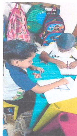
Turma 5: Maternal IIB

Campo de Experiência: Corpo, gesto e movimento.